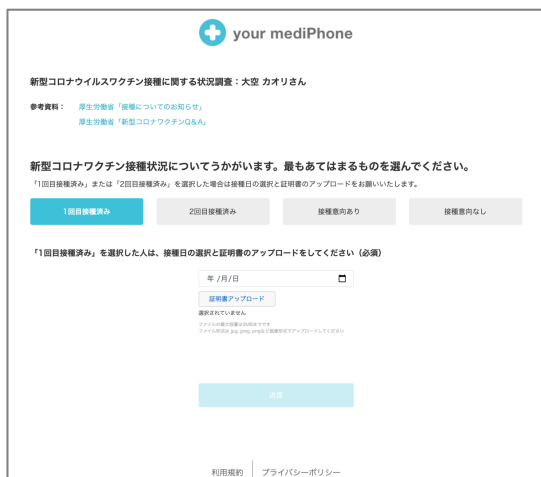
【従業員向け】接種状況報告画面